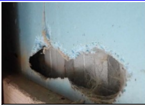
鶏舎壁面のラットサイン

全国(特に北海道や東北地方)において、 野鳥(ハシブトガラス等)での高病原性鳥インフルエンザ(HPAI)が多発 しています(野鳥:59事例(3/29時点))。また、 3/25宮城県石巻市の肉用種鶏農場で家きん17例目のHPAI(亜型:H5)が確認されており、都内でも野鳥やネズミ等の野生動物により、HPAIウイルスが家きん舎内に持ち込まれることが十分考えられます。ネズミやネコ等、哺乳類の糞や歩行跡、断熱材のかじり跡や防鳥ネットの破損の有無、卵の食痕など野生動物侵入の痕跡の有無について再確認し、網等の修繕をお願いします。 引き続き、早期発見・早期通報の徹底、飼養衛生管理基準(特に7項目)の遵守をお願いします。